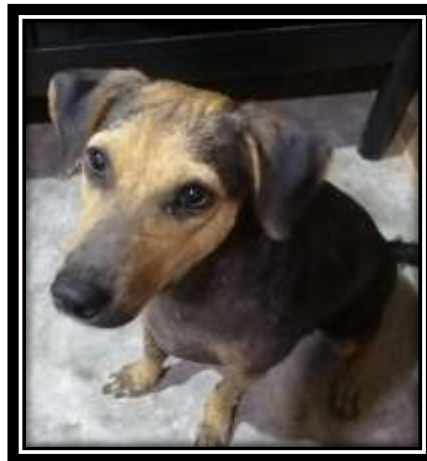
Imagen 2. Evolución de la paciente 2 meses