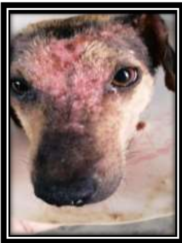
Imagen 1 . lesiones en piel