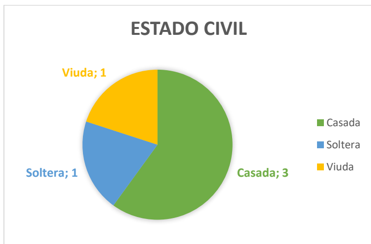
Figura 2. Estado civil.

Todas las mujeres estuvieron o se encontraban casadas en el momento de la entrevista.