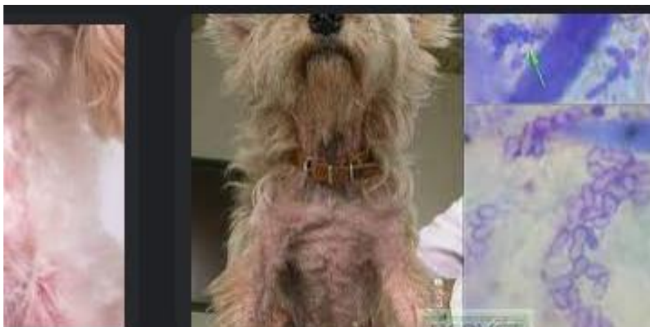
Figura 3. Dermatitis seborreica.