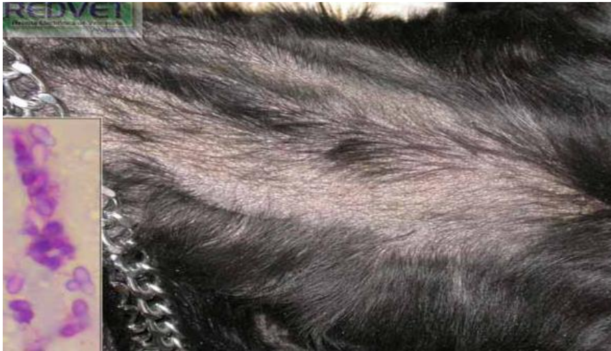
Figura 2. Dermatitis atópica en perros