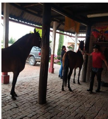
Imagen 22. (Córdoba, 2024)