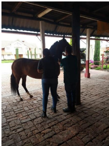
Imagen 21. (Córdoba, 2024)