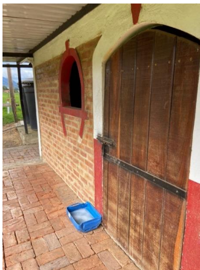
Imagen 12. Pesebrera de aislamiento. (Córdoba, 2024)