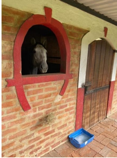
Imagen 18. Pesebrera de aislamiento. (Córdoba, 2024)

Finalmente, animales con signos de enfermedad también serán aislados para evitar el riesgo de diseminación.