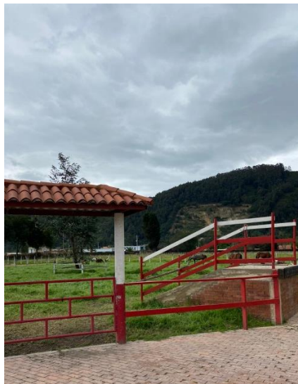
Imagen 7. Zona verde delimitada elegida para realizar el embarque de animales, recepción de animales previo al desplazamiento hacia la zona de cuarentena (Córdoba, 2024)