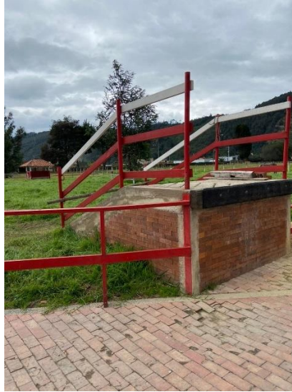
Imagen 6. Desembarcadero. (Córdoba, 2024)

aislamiento de animales enfermos y cuáles son los lugares adecuados para realizar la instalación de los pediluvios de manera que cumplan adecuadamente con su función.