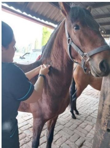
Imagen 23. (Córdoba, 2024)