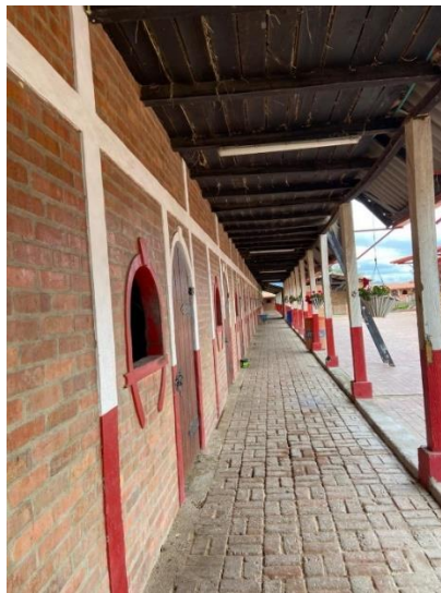
Imagen 3. Pesebreras. (Córdoba, 2024)