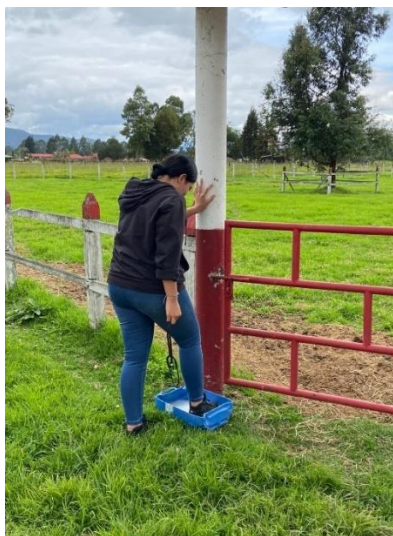
Imagen 10. Uso de pediluvios por parte del personal médico previo al ingreso a zona de aislamiento. (Córdoba, 2024)

Se plantea a los trabajadores la limpieza y desinfección de comederos, pesebreras y lugar de almacenamiento de alimento al menos una vez al mes. Con ayuda de aspersores para las paredes y pisos y el constante lavado de comederos. Se realizan pediluvios con galones y se instalan a la entrada del espacio de aislamiento tanto en potrero como en la pesebrera destinada para tal fin.