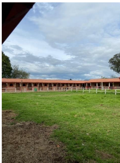
Imagen 4. Parte de la zona verde y se logra evidenciar parte del área que se encuentra en arriendo. (Córdoba, 2024)