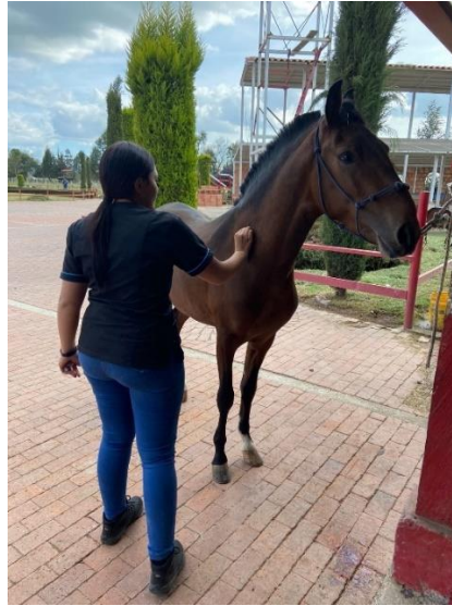
Imagen 16. Desinfección de la zona y posterior aplicación de la vacuna. (Córdoba, 2024)