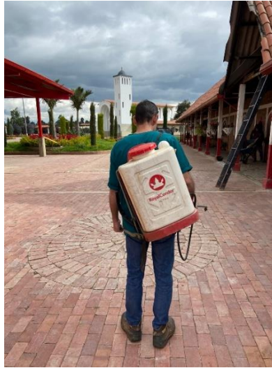
Imagen 13. Demostración uso de aspersor para la limpieza y desinfección de las instalaciones. (Córdoba, 2024)