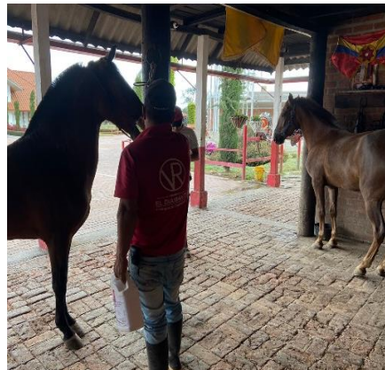
Imagen 17. Ejemplares en observación posterior a la aplicación de la vacuna. (Córdoba, 2024)