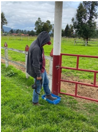
Imagen 11. Uso de pediluvios por parte del personal del lugar. (Córdoba, 2024)