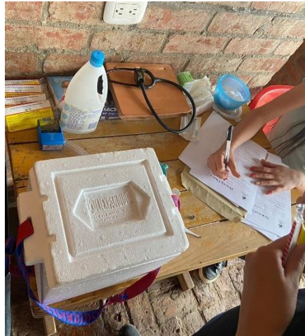
Imagen 14. Herramientas empleadas para el desarrollo de la jornada de vacunación. (Córdoba, 2024)

Este proceso se lleva a cabo un viernes para así mantener en observación a los ejemplares durante el fin de semana sin que sean sometidos a ejercicio.