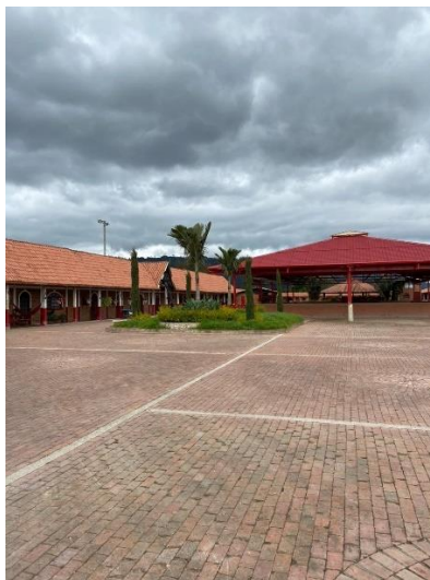
Imagen 2. Vista general del establecimiento. (Córdoba, 2024)