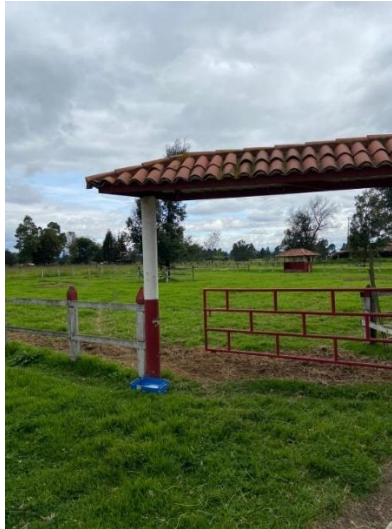
Imagen 8. Zona verde delimitada elegida para realizar el aislamiento preventivo (cuarentena) de animales recién llegados de eventos equinos y otros predios. (Córdoba, 2024)