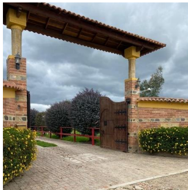
Imagen 1. Entrada al establecimiento. (Córdoba, 2024)