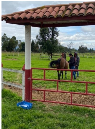
Imagen 19. Monitoreo clínico de ejemplar en aislamiento preventivo. (Córdoba, 2024)