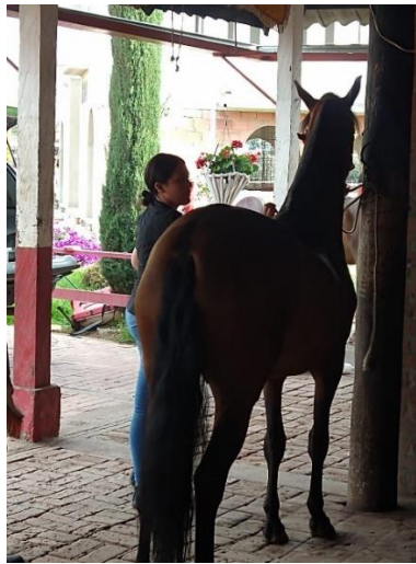
Imagen 20. 21. 22. 23. Aplicación de vacuna en ejemplar. (Córdoba, 2024)

Se decide realizar una segunda jornada de vacunación, dos meses posteriores a la primera, como lo recomienda el laboratorio de las vacunas empleadas en este protocolo. Esta segunda jornada se realiza el viernes 5 de julio teniendo en cuenta las mismas condiciones de la jornada anterior. Sin embargo, al realizar esta jornada algunos de los ejemplares que se habían vacunado antes, habían sido vendidos, en otros casos había animales que presentaban signos de enfermedad o yeguas que, en el periodo comprendido entre una jornada y otra, habían sido inseminadas con resultados exitosos, por lo que no cumplen con las condiciones para su respectiva revacunación.