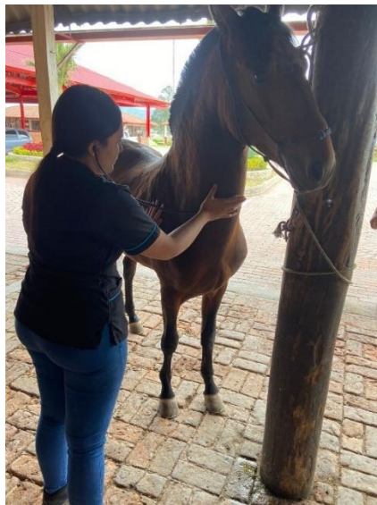
Imagen 15. Realización de examen clínico a ejemplar previo a la aplicación de la vacuna. (Córdoba, 2024)