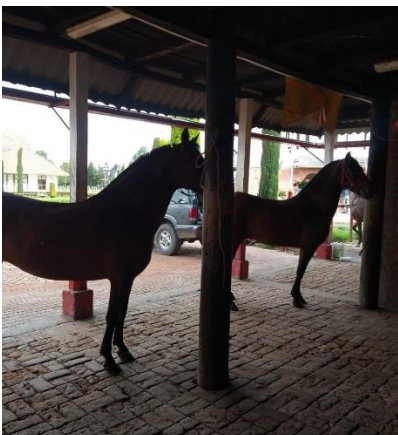
Imagen 24. Animales en observación posterior a la aplicación de la vacuna. (Córdoba, 2024)