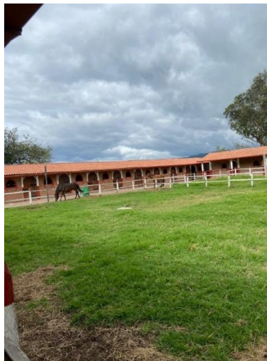
Imagen 9. Zona verde delimitada como espacio abierto para yeguas junto a sus potros con una amplia distancia de la zona de cuarentena y el desembarcadero. (Córdoba, 2024)