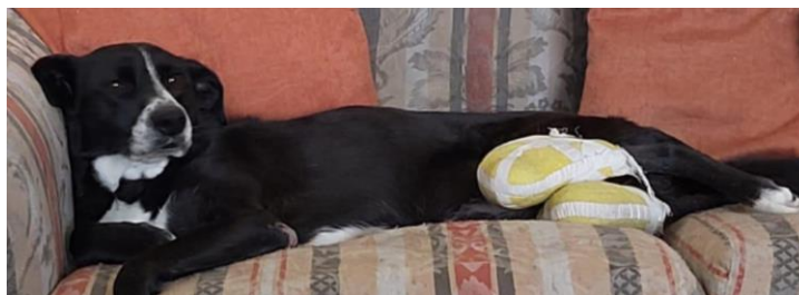
Figura 3 Paciente Lulu

En el presente estudio participa una paciente canina la cual presenta dolor osteoarticular crónico.