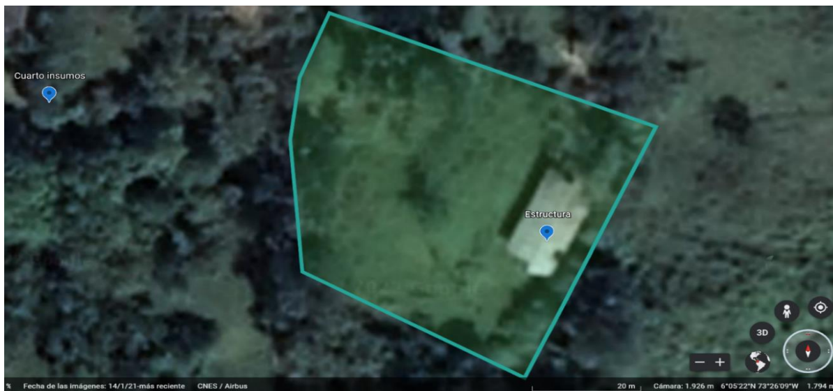
Ilustración 3 Estructura del lote

Finalmente, la siguiente ilustración es la última imagen que reporta Google earth en el año 2021 de la estructura, el lote y el cuarto de insumos que se podría utilizar para beneficio del sitio.